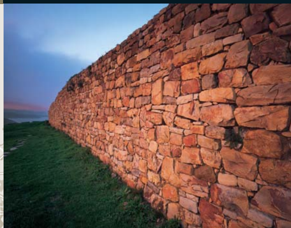
Muralla prerromana de módulos de la Campa Torres [portada] Vista aérea del Parque Arqueológico-Natural de la Campa Torres [abajo]